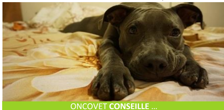
ONCOVET CONSEILLE ...

Le thymome ou tumeur du thymus est fréquent chez le lapin. Le thymus est un organe situé dans le thorax, qui produit des cellules du système immunitaire. Les symptômes apparaissent souvent de façon brutale. Le thymome peut provoquer un essoufflement obligeant l'animal à respirer la bouche ouverte, ou comprimer les veines de retour de toute la tête, poussant alors les yeux vers l'extérieur.