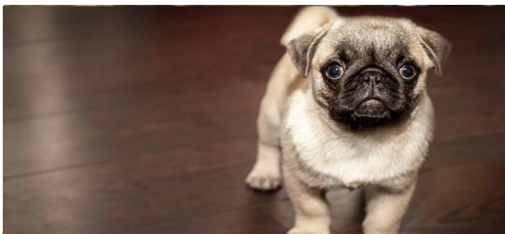
ONCOVET CONSEILLE ...

Si les hernies discales peuvent toucher tous les chiens, certaines races y sont prédisposées, en raison de la forme de leur colonne vertébrale. Le teckel, le bouledogue français, le cocker ou encore le Shih Tzu ou le carlin... Les chiens de petite taille sont davantage touchés et bien souvent brutalement, suite à un faux mouvement (saut du canapé par exemple) ou à un choc. Selon sa localisation, l'animal peut être uniquement douloureux (région haute, cervicales) jusqu'à être paralysé des pattes arrières (région basse, lombaires).