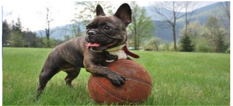
ONCOVET RECOMMANDE ...

Si les hernies discales peuvent toucher tous les chiens, certaines races y sont prédisposées, en raison de la forme de leur colonne vertébrale. Le teckel, le bouledogue français, le cocker ou encore le Shih Tzu ou le carlin... Les chiens de petite taille sont davantage touchés et bien souvent brutalement, suite à un faux mouvement (saut du canapé par exemple) ou à un choc. Selon sa localisation, l'animal peut être uniquement douloureux (région haute, cervicales) jusqu'à être paralysé des pattes arrières (région basse, lombaires).