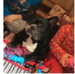
Témoignage reçu de Stitch

« Voilà, aujourd'hui je souffle ma 9 ème bougie et cela grâce à vous qui avec tout votre amour et vos petites mains en or, m'ont aidé à combattre cette vilaine tumeur dans la gueule il y a 2 ans déjà ! Merci à tous ! J'ai été gâté par ma famille. Léchouille de Stitch ! »